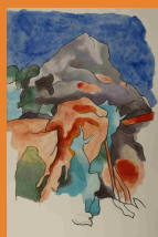
Henri Cueco, d'après Cézanne, La montagne Saint-Victoire vue de Bibémus. 2012