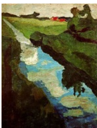
Fossé dans le marais (Moorgraben) Entre 1900 et 1902 -coll.

Jusqu'au 21 août, le musée d'art moderne de la ville de Paris montre pour la première fois les oeuvres de l'artiste allemande décédée en 1907 à l'âge de 31 ans.