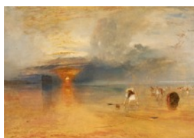
Calais Sands at Low Water, Poissards Collecting Bait - Joseph Mallord William Turner

Magnifiquement interprété par un Timothy Spall complètement transformé et défiguré, on peut trouver le film de Mike Leigh en D.V.D. ou V.O.D. (à louer ou à acheter).