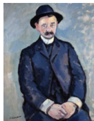
Charles Camoin, Portrait d'Albert Marquet-1904 Montpellier, musée Fabre Don de Mme Albert Marquet en 1951 ; dépôt du Centre Pompidou, musée national d'art moderne – Centre de création industrielle

http://www.caumont-centredart.com/sites/hdc/files/dp_turner_bd.pdf