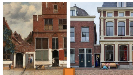
A gauche la ruelle en 1658. A droite, en 2015.